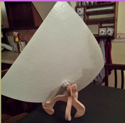
Aragn: due parti in legno massello che si accoppiano a formare un supporto da tavolo