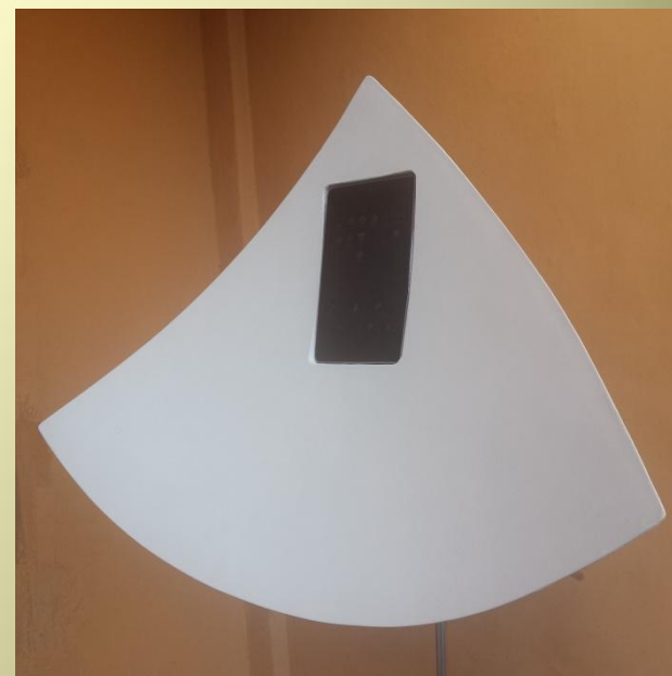
Modello Tab con cavità porta tablet Realizzata su misura