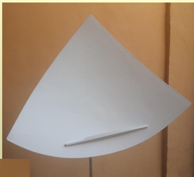
Modello Lectern con porta spartito