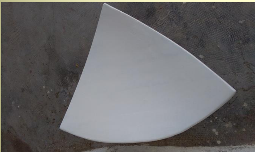
Forma finita del Flat Binel