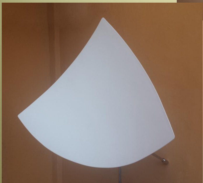
Modello Flat, prevalentemente per voce e strumenti musicali