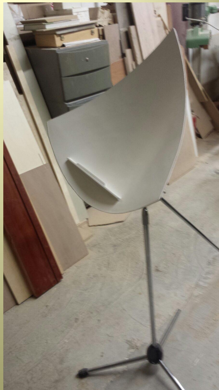
Binel montato per test