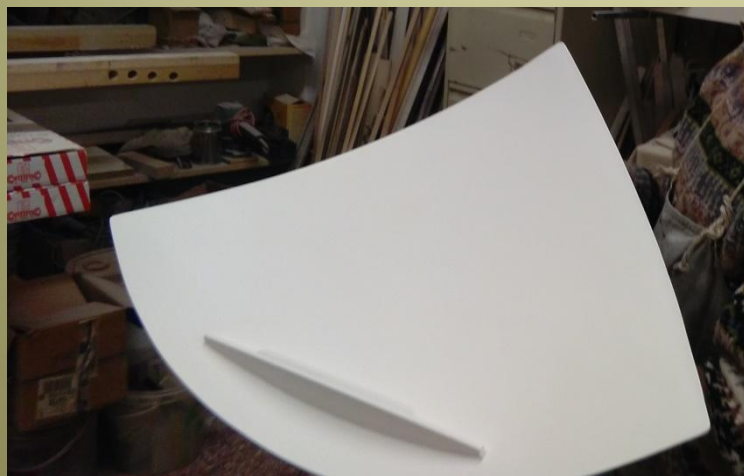
Rifinitura e stuccatura del Lectern Binel